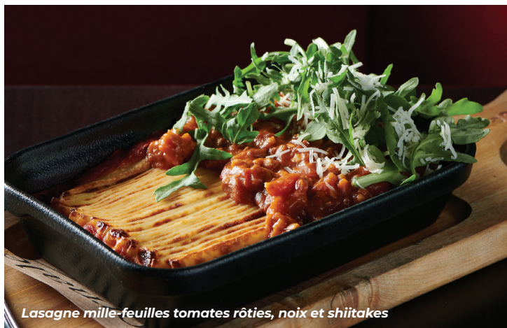
Lasagne mille-feuilles tomates rôties, noix et shiitakes