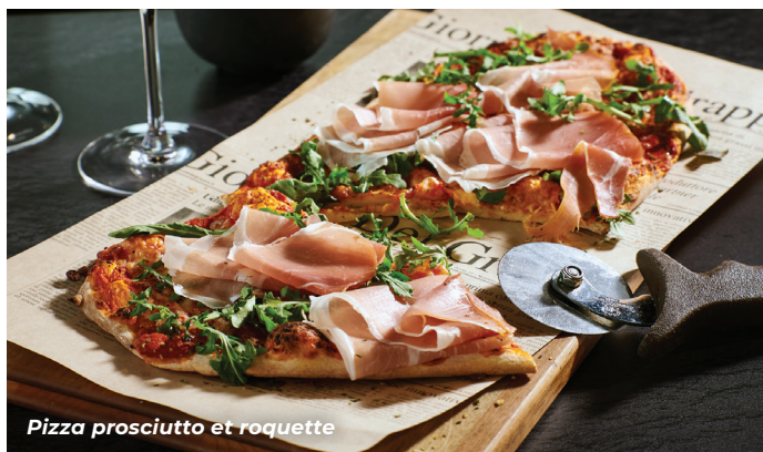
Pizza prosciutto et roquette

Laitues de saison, oignon, concombre, vinaigrette citron, réduction de vinaigre balsamique.