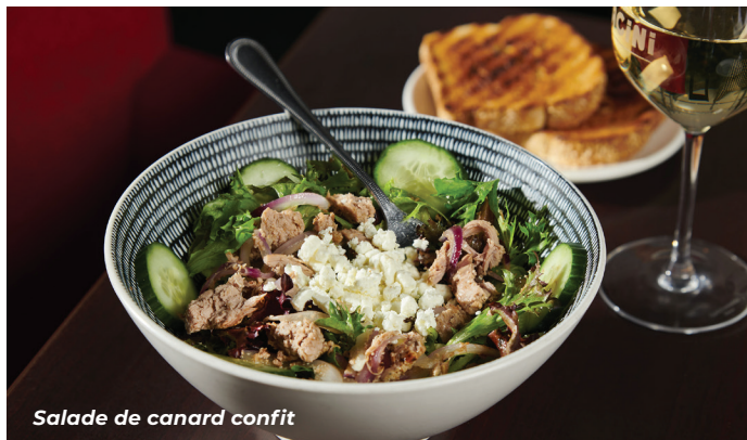
Salade de canard confit