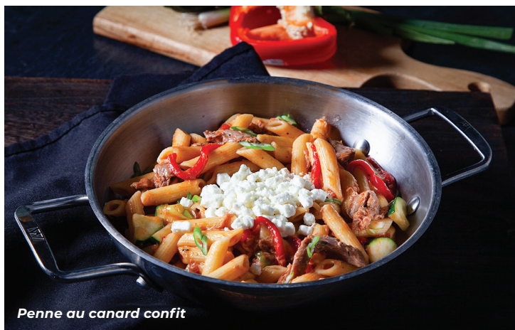
Penne au canard confit