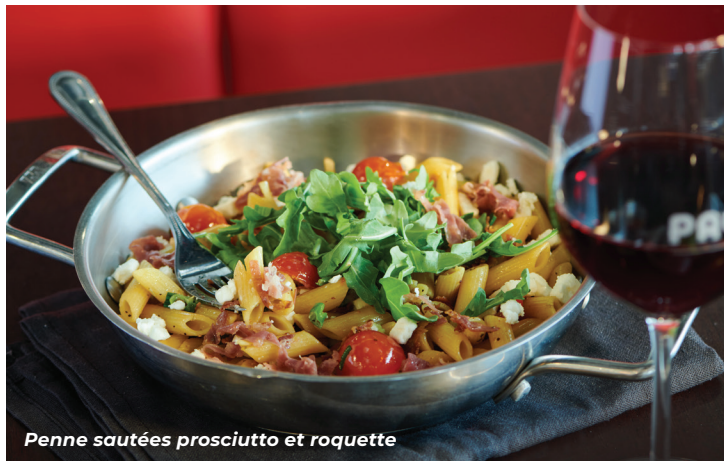
Penne sautées prosciutto et roquette